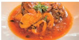
小浜の漁師風スープ