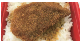
敦賀真鯛のソースカツ丼