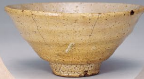
【重要文化財】青井戸茶碗 銘 柴田 (根津美術館所蔵)

柴田勝家画像復元模写(滋賀県立安土城考古博物館所蔵) 伝柴田勝家所用 金幣馬印(西光寺所蔵)、腕ヶ岳合戦図屏風 右隻(長浜城歴史博物館所蔵)