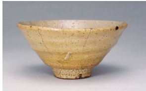
青井戸茶碗 銘 柴田(根津美術館所蔵)