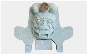
伝北庄城跡出土土石瓦復元(福井市所蔵)