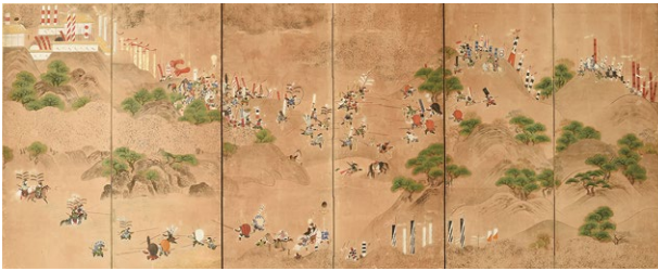
賤ヶ岳合戦図屏風 右隻(長浜城歴史博物館所蔵)