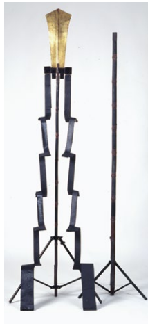
伝柴田勝家所用 金幣馬印(西光寺所蔵)