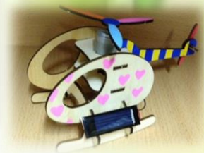
太陽光パネルを使ったおもちゃ