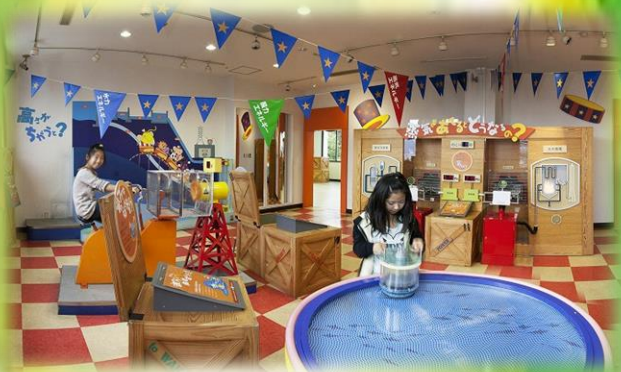
原子力の科学館「あっとほうむ」