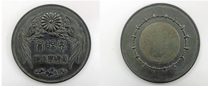
第2回恩賜賞の賞牌（裏面(右)に「明治45年授 平瀬作五郎」と刻まれている） 1912年。

この賞牌は、平瀬の、植物学の進化の解明に貢献した発見に対するものである。帝国学士院の恩賜賞は、湯川秀樹や野口英世、寺田寅彦らの研究者が受賞してきた日本で最も権威ある学術賞である。