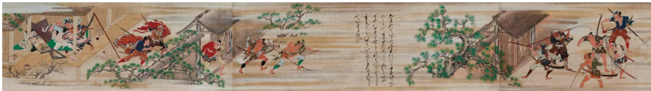
重文「山中常盤物語絵巻」第4巻(部分) MOA美術館【通期】

意外や意外? 絵巻にも優れた才能を発揮した又兵衛。現存数57巻、総延長はなんと800メートル以上! 「山中常盤物語絵巻」や「上瑠璃物語絵巻」など名作が揃います。近世随一の絵巻絵師又兵衛の、華麗な色彩と躍動感あふれる画面に注目です。