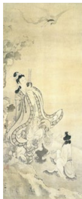
重文「弄玉仙図」 摘水軒記念文化振興財団【通期】