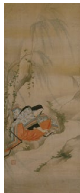
重美「伊勢物語 鳥の子図」 東京国立博物館【通期】