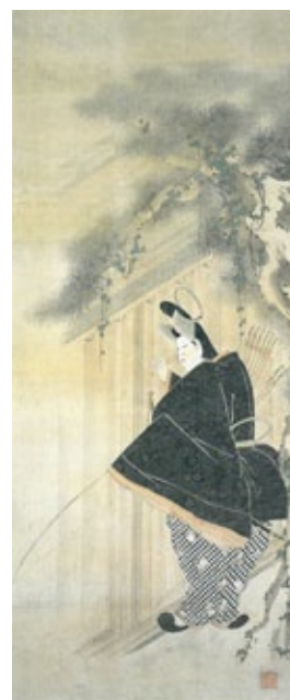
重文「伊勢物語 梓弓図」 文化庁【通期】