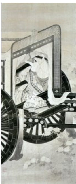
重文「官女観菊図」 山種美術館【8/26~8/28】