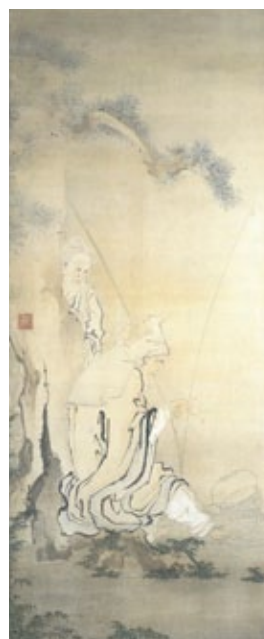
重美「龐居士図」 福井県立美術館【通期】