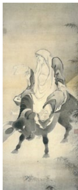
「老子出関図」 東京国立博物館【通期】