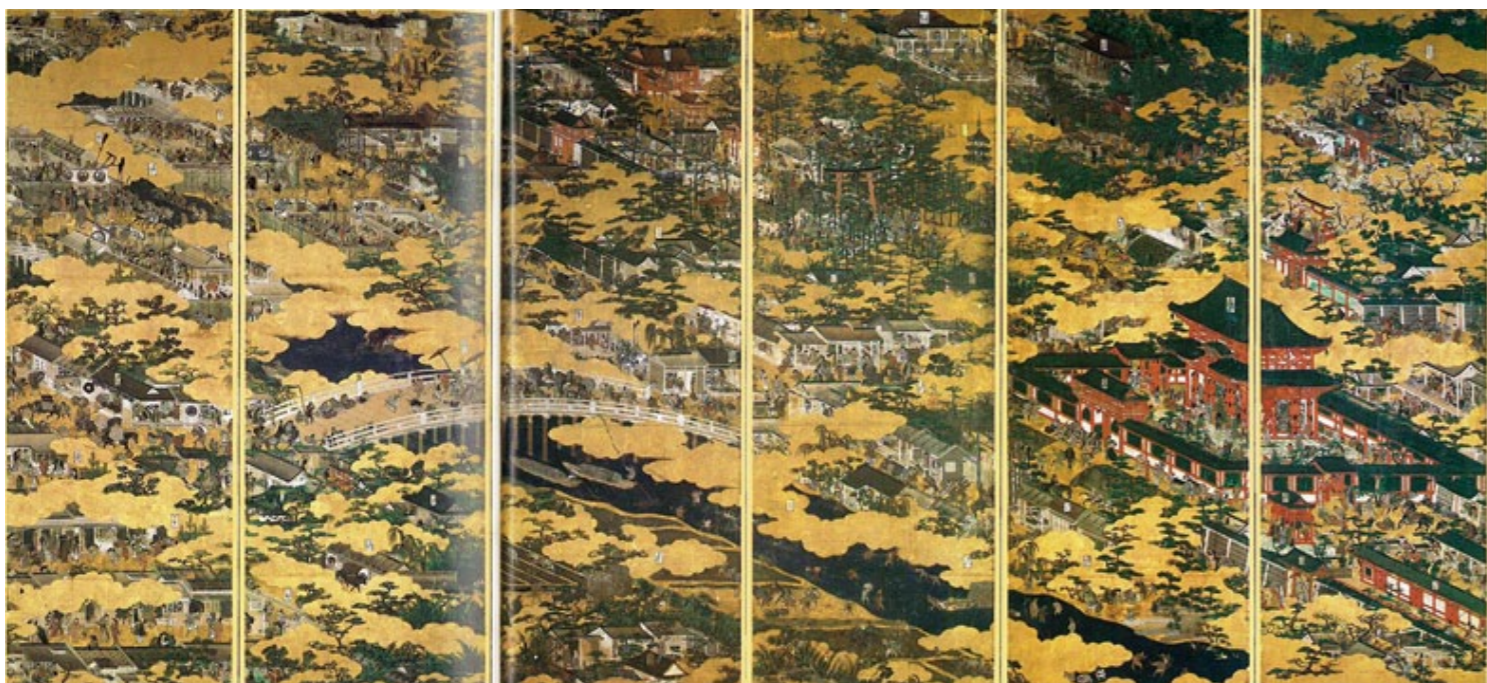
国宝「洛中洛外図屏風(舟木本)」(右隻) 東京国立博物館【8/6~8/28】