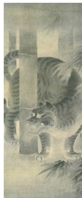
「虎図」 東京国立博物館【通期】