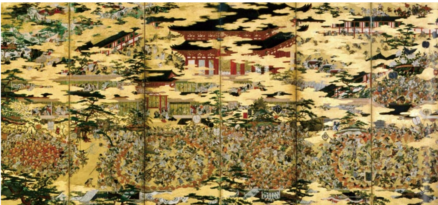
重文「豊国祭礼図屏風」(左隻) 徳川美術館【7/22~8/7】

福井市文京3-16-1 TEL: 0776-25-0452 FAX: 0776-25-0459