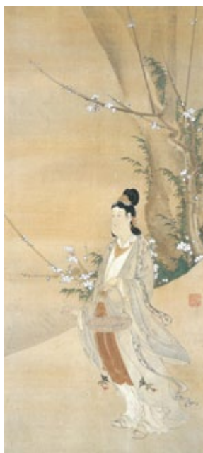
重美「羅浮仙図」【通期】