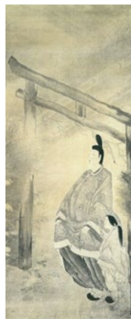
重美「源氏物語 野々宮図」 出光美術館【8/13~8/28】