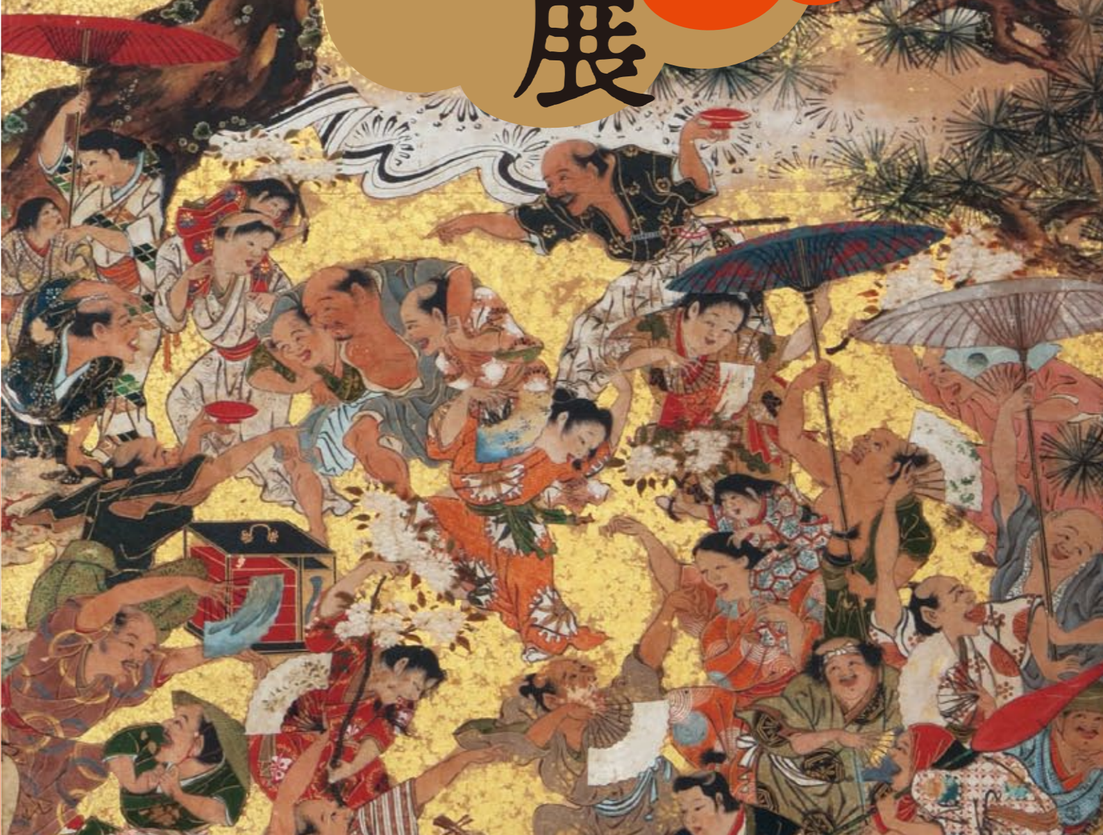
「花見遊楽図屏風」(部分)