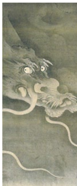
「雲龍図」 東京国立博物館【通期】

福井の豪商金屋家に秘蔵された12図からなる屏風絵。明治末に分散し、コレクターの間を転々として、今回100年の時を経て、現存10図が初の再会です。龍虎と和漢の人物が織りなす、妖しくも美しい「又兵衛ワールド」全開の超大作! (※10図同時展示は8/26~8/28のみ)