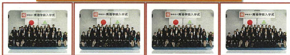
学校法人青池学園 青池調理師専門学校 日本語科