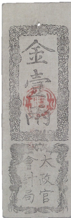
太政官札 明治元年(1868) 国立印刷局お札と切手の博物館蔵 由利公正の発案により発行された全国通用紙幣