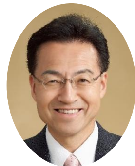
知事 杉本 達治