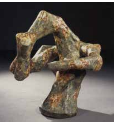
角 喜代則《大地の子》