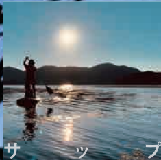
サ ッ プ

8月10日(土) 18:30-20:00 (予約不要) 中川毅教授、学芸員らによる年縞博物館と縄文博物館の常設展およびエジプト展のガイドツアー。