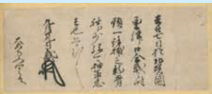
▲大安寺又四郎宛 朝倉義景 感状