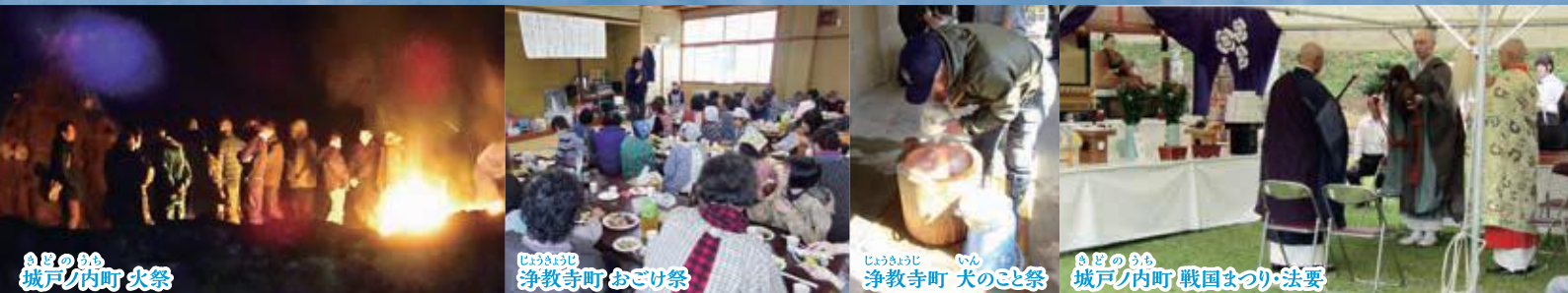
あまのうち 城戸ノ内町 火祭