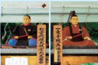
▲朝倉孝景(右)・義景(左) 木像(個人蔵)