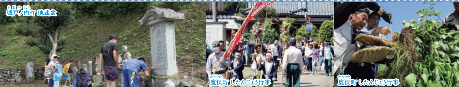
あまのうち 城戸ノ内町 地蔵盆