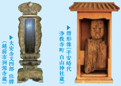
▶ 大安寺又四郎 位牌 (越前市洞源寺蔵)