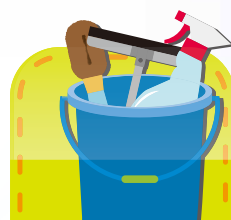
ビルクリーニング