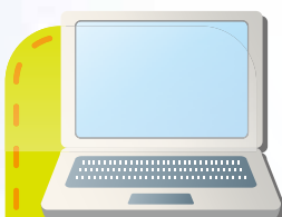
ワード・プロセッサ