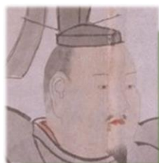
▲足利義昭画像