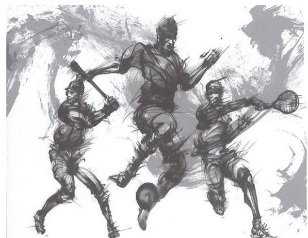
NHK 総合「news watch 9」オープニングビジュアル