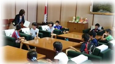
応接室で知事気分

ちじ おうせつしつ きひんしつ そうごうぼうさい ふくいじょうし けんけいさつほんぶ ～ 知事応接室、貴賓室、総合防災センター、福井城址、県警察本部 ～