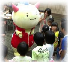
はぴいゅうと 記念撮影!

※天候や業務の都合等により見学か所や内容等が予告なく変更になる場合がございます。