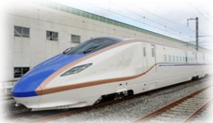
もっと知りたい! 北陸新幹線