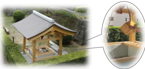
福井城址(「福の井」でつるべ水くみ体験！)