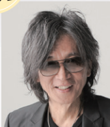
藤田 宜永氏