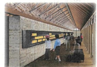
約7万年分・45mの水月湖年縞を直線的に展示