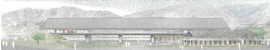
年縞博物館（平成30年9月開館予定）完成予想図