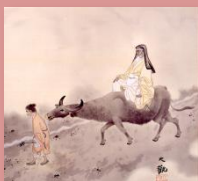
横山大観「老君出関」(部分) (当館蔵)

[住所] 福井市文京 3-16-1 [電話] 0776-25-0452 [開館時間] ※期間中開館延長日あり 9~17時 (入館は16時半まで)