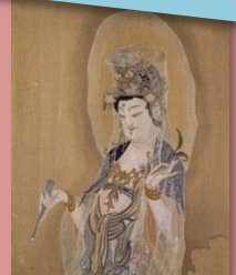
悲母観音綴織額(部分) (東京国立博物館蔵)

[住所] 福井市宝永 3-12-1 [電話] 0776-21-0489 [開館時間] 9~19時(入館は18時半まで)