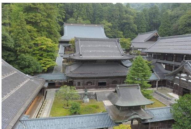
永平寺主要伽藍（手前から中雀門、仏殿、法堂）

*鎌倉時代に禅宗とともに伝わった建築様式で、全体に木割が細く、組物を多く配し、花頭窓を用いるなど装飾的な造作が特徴。軒の反りも強い。