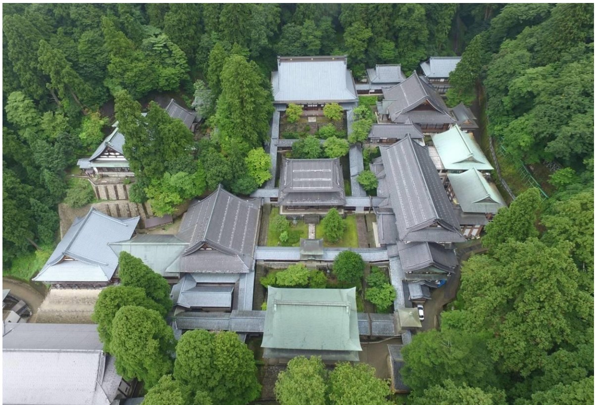
永平寺主要伽藍 (中央奥の建物が法堂、手前の建物が山門)