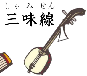
しゃみせん 三味線