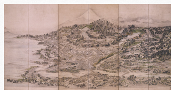
江戸一目図屏風 (津山郷土博物館蔵)

福井藩松平家の拠点都市であった「福井」は、全国有数の城下町でした。特別展では、福井をはじめ、「三都」と称される巨大都市、江戸・京・大坂を描いた屏風や絵巻、絵図、浮世絵などを展示して、江戸時代の都市の魅力に迫ります。