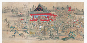
浅草寺境内図屏風 (越葵文庫 当館保管)

福井市宝永3-12-1 ☎ 0776-21-0489 9時～19時（入館は18時半まで） 4月16日（月） 特別展入場料 一般：700円、大学・高校生：500円、中学生以下・70歳以上：無料