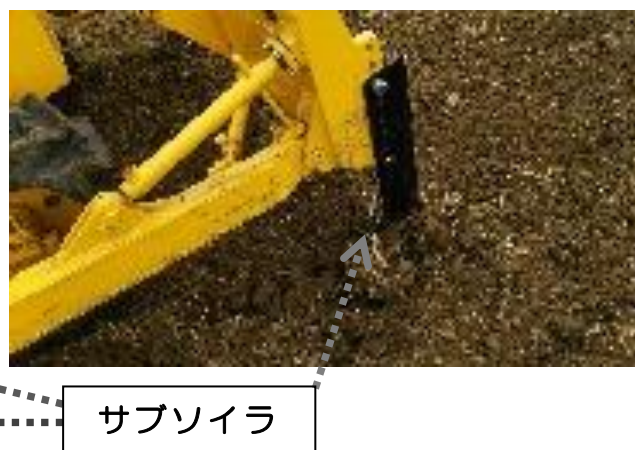
図2 排土板に装備したサブソイラ