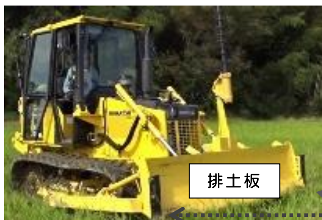
図1 ブルドーザ外観