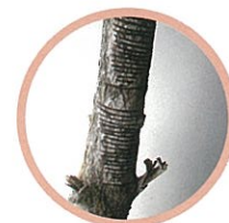
漆の原材料はウルシの木に傷をつけ、樹液を掻きとり採取します。

福井県鯖江市の東部にある河和田地区は、約 1,500 年の歴史をもつ越前漆器や、国内唯一の産地として眼鏡づくりを行う、ものづくりのまちです。三方を山に囲まれ、約 4,400 人が住むこの小さな集落では、古くから独特な文化を形成してきました。