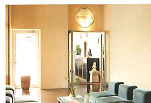
リフレッシュサロン UNWIND (アンワインド)