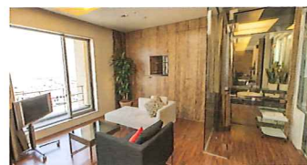
プレミアムテラスポート-a

バイエリアのすばらしい眺望と、選り抜かれたインテリア。リゾート感あふれるゲストルームは素敵なくつろぎの空間です。ゆったりとした居室とバスルーム。そして快適さを追求した設備品。スタイされるお客様に合わせて選べる11のルームタイプをご用意しました。