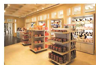
ユニバーサル・スタジオ・ストア