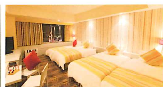
ファミリーポート-a