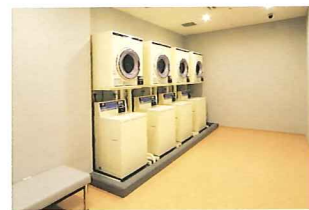
コインランドリー