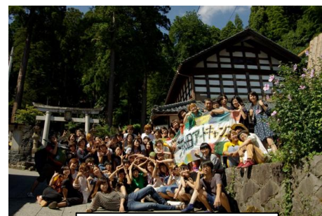
鯖江市河和田地区