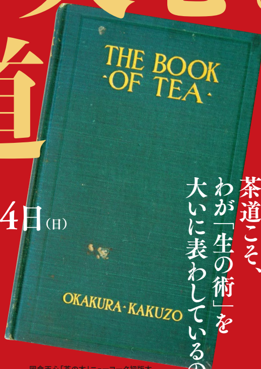
岡倉天心「茶の本」ニューヨーク初版本