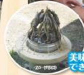
美味しい塩焼きの できあがり!!