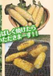
香ばしく焼いたら いただきます!!