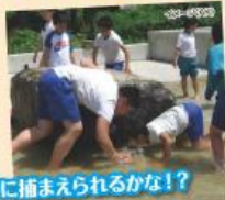
上手に捕まえられるかな?!

水着に着替えて魚つかみ! 魚の構造やさばき方を学び、塩焼きのための串を刺します。 魚屋さんみたいに上手に刺せるかな?!