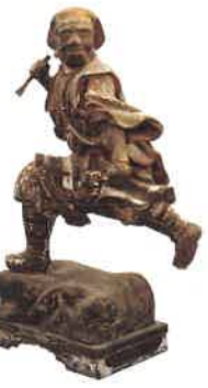
伽藍神立像 監斎使者 (鎌倉時代) (永平寺蔵)

第2章 教えに会おう、修行とくらし ここでは、道元禪師の教えを伝える品を中心に展示します。併せて、永平寺内における修行について、映像や画像を含めて紹介します。 ◎普勤坐禅儀（10月15日まで、17日以降複製展示。） ◎普勤坐禅儀撰述記（〃） ◎正法眼蔵仏性等 ◎すれも永平寺蔵