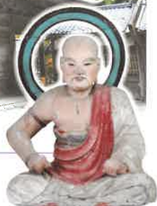
五百羅漢坐像 康傳作 (江戸時代) (永平寺蔵)