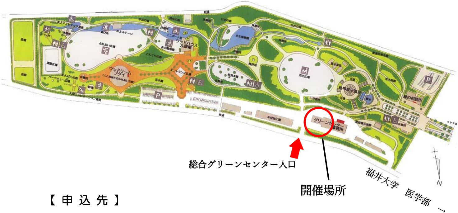
総合グリーンセンター配置図