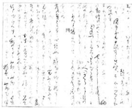
樋口一葉「たけくらべ」草稿 (日本近代文学館蔵)

本展では、近代文学を切り口に、文明開化の激流の中、新しい文化を切り拓いていった明治時代を振り返ります。