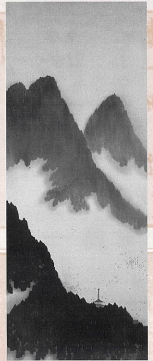
横山大観「群鴉」 (福井県立美術館蔵) (展示期間：1月20日～2月21日)