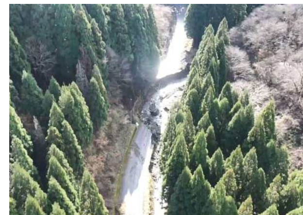
【南越前町栃ノ木峠 上空】