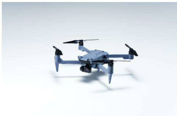
【災害用ドローンの配備】