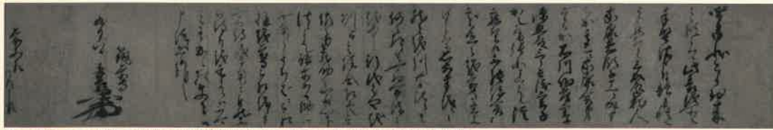
(天正12年)9月8日付 羽柴秀吉書状(尊経閣古文書集 当家文書2)(財団法人前田育徳会蔵)