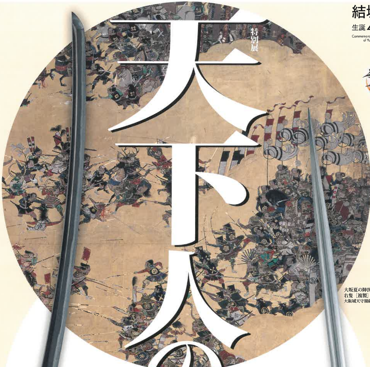
大坂夏の陣図屏風 右隻〔複製〕(部分) 大坂城天守閣蔵