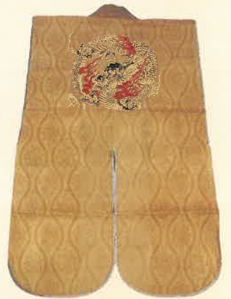
前橋藩主松平家陣羽織 (前橋東照宮蔵)