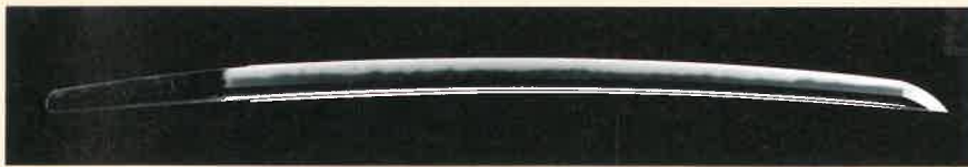
小太刀 額銘 長光(秀康より直政拝領)(松江歴史館蔵)