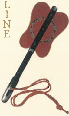
前橋藩主松平家軍配 (前橋東照宮蔵)