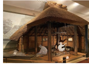
竪穴建物／古墳時代初期の玉づくりの現場です。緑色凝灰岩を使って、管玉や腕輪形の石製品を作っている様子を推定復元しました。玉を砥石で磨く人や、出来上がりを確かめている人の姿もみえます。