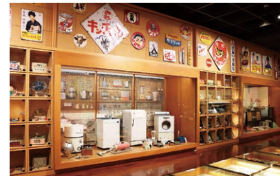
昭和の生活用品／昭和30～40年代に使われた生活用品を展示しています。洗たく機、冷蔵庫、テレビなどの家電から、当時流行した玩具まで、多様な資料が見どころです。