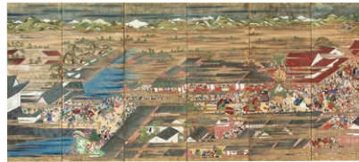
《馬威図屏風》江戸時代末期