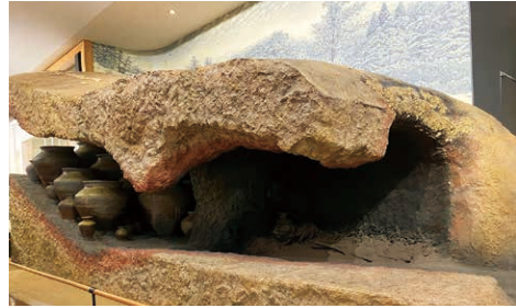
越前焼の窯／鎌倉時代後期の越前焼の窯です。越前町に残る窯跡をモデルにしています。この頃の窯は、山の斜面に穴を掘って造られました。窯の入り口から全体の約3分の2を推定復元しています。

福井県にゆかりのある実物または現象に関する資料をコレクションの軸として、福井の歴史の中で生み出された「モノ」と時代背景をあわせて常設展示を組み立てています。