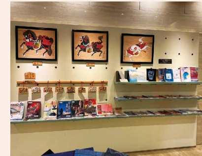
福井県立歴史博物館

図録 各1,000~2,000円 福井県立歴史博物館がこれまでに開催した特別展図録です。