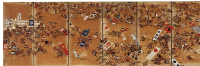
林義親 < 姉川合戦図屏風 > 江戸時代 天保8年(1837)