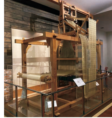
ジャカード織機 国産ジャカード(自動紋織装置)をのせた明治10年代の織機を復元しました。福井ではこの頃に国産ジャカード織機を使って、ハンカチや傘地など、模様をついた洋風の布を織り始めました。後に福井は「繊維王国」ともよばれました。