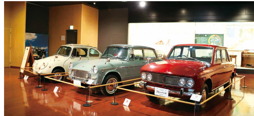
マイカー／昭和30～40年代前半の自家用車を展示しています。昭和30年代に入ると国内で大衆車の生産が盛んになり、マイカーをもつ家も増え始めました。