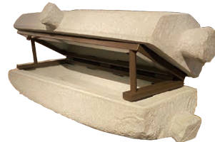
石棺／古墳時代前期の石棺を復元したものです。足羽山で採掘された越前青石（笏谷石）製で、蓋には鏡をかたどった文様が浮き彫りされています。