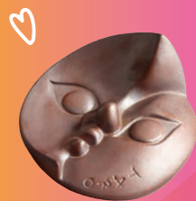
とうげいかん こようはく