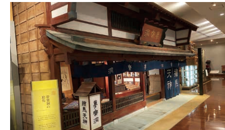
絵馬工房／江戸時代中期から大正期まで代替わりしながら福井で活動した町絵師、夢楽洞の工房です。江戸末期から明治初年の様子を推定復元しています。