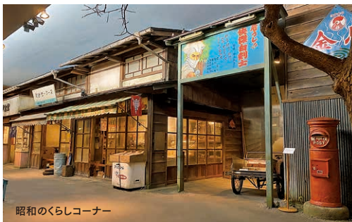
昭和のくらしコーナー