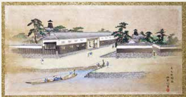
福井城下図屏風「毛矢町繰舟」 福井市立郷土歴史博物館所蔵

〈福井市史 一部加筆〉 ※「毛屋」は、現在の地名である「毛矢」で統一しています。