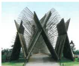
※作品はイメージです。