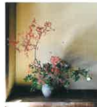
※作品はイメージです。