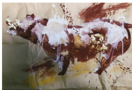
サイ H30×W45 (cm) 水彩 ドローイング 2022年