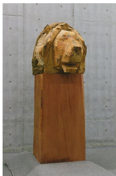
vanishing point ('18) H180×D60×W 50 (cm) 銀杏 2018年