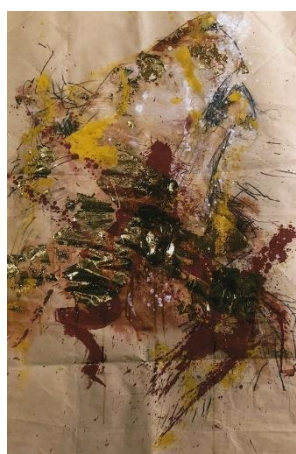
vanisning point H50×W 45 (cm) 水彩 ドローイング 2022年