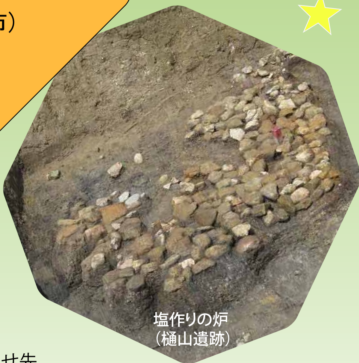
塩作りの炉 (樋山遺跡)