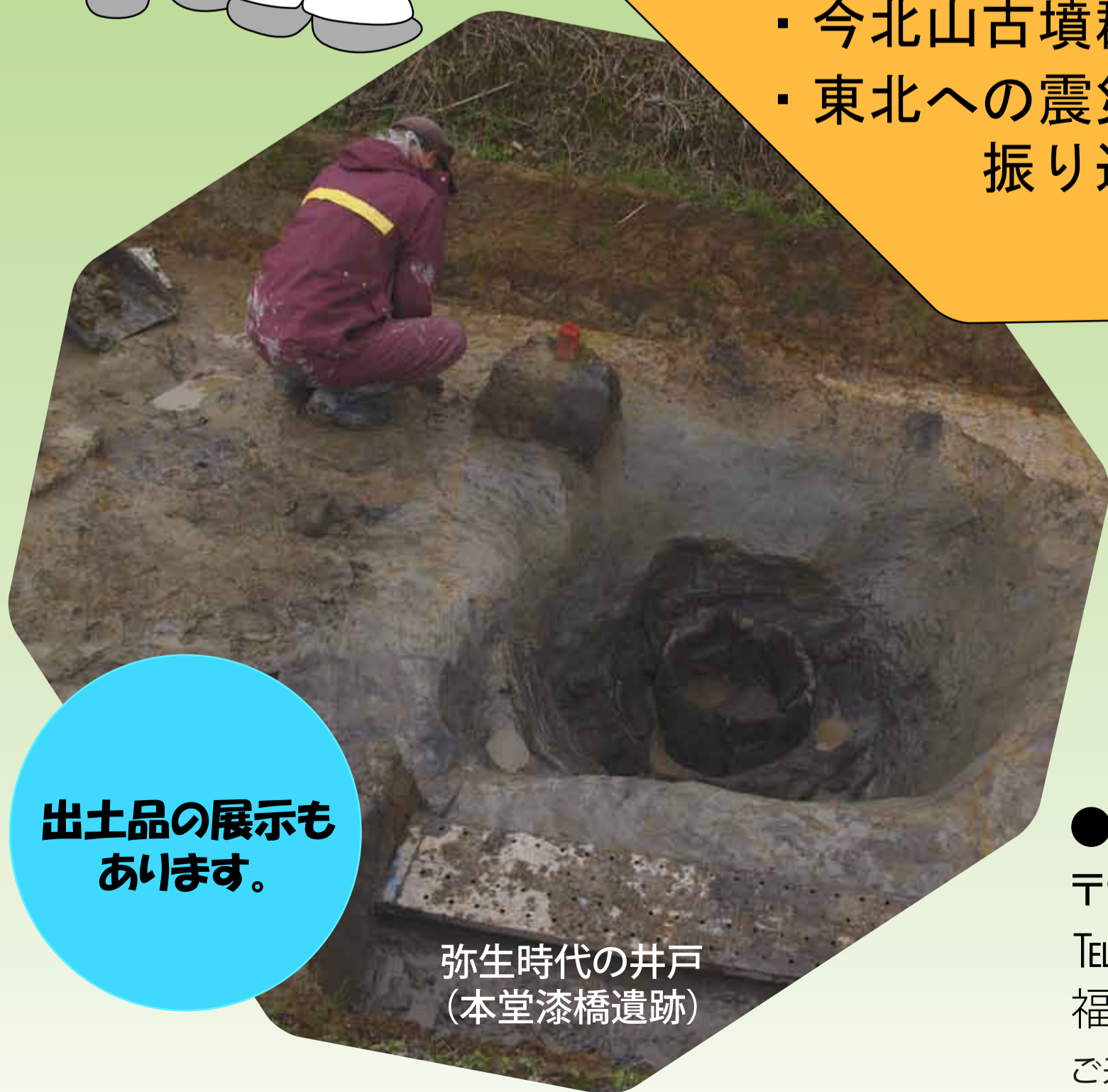
弥生時代の井戸 (本堂漆橋遺跡)