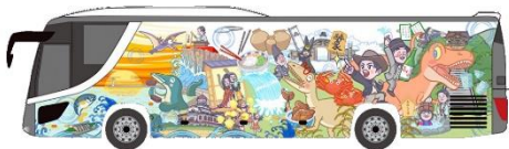
XR バ斯拉ッピングイメージ（左面）