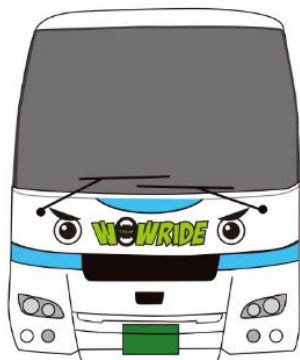
「FUK (ふく) ちゃん」