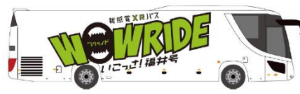
XR バ斯拉ッピングイメージ（右面）