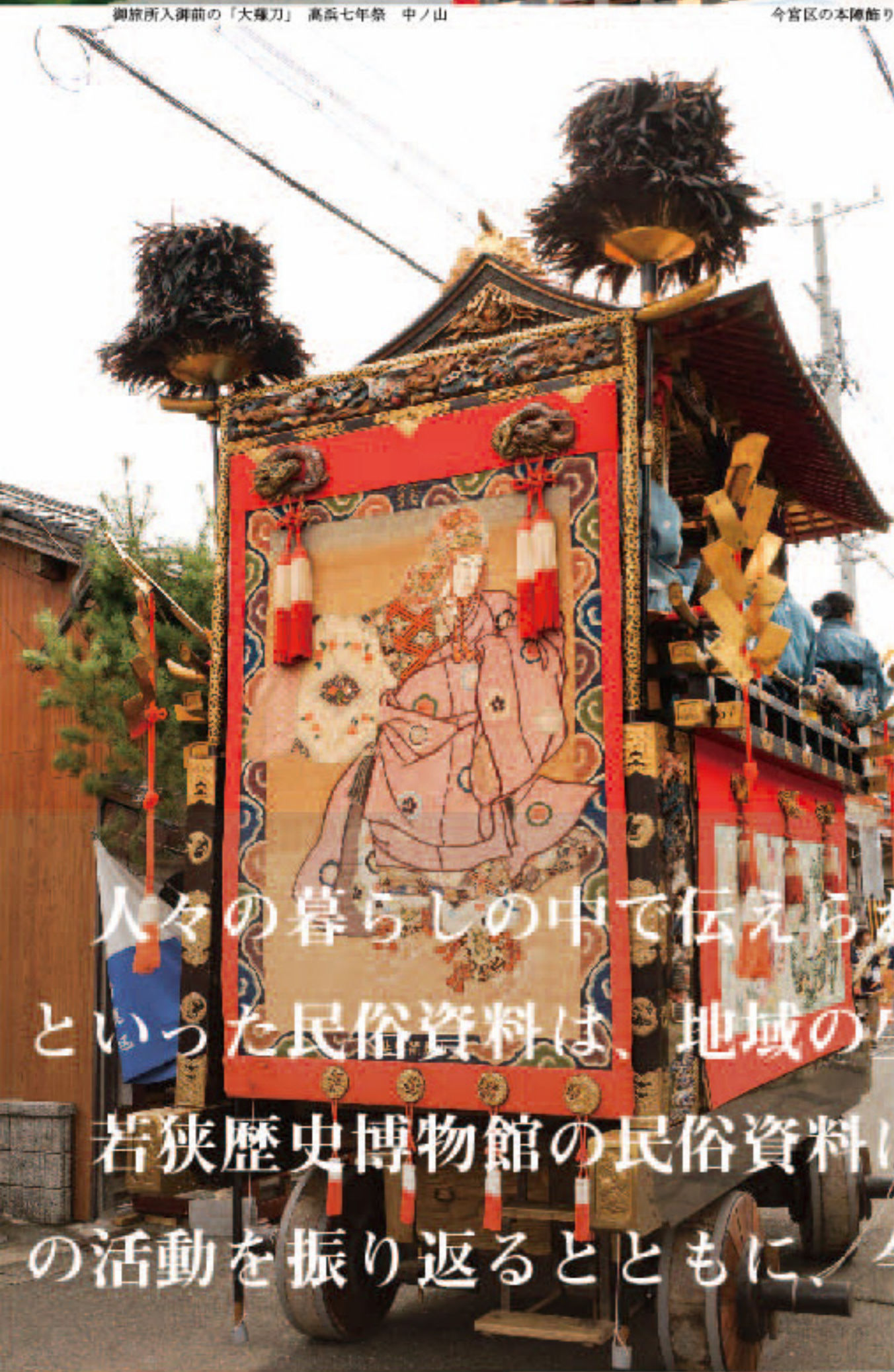
現在の清滝区山車「大津町山」