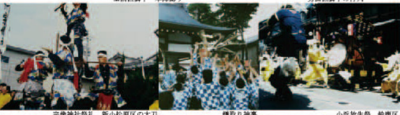
宗像神社祭礼 新小松原区の太刀