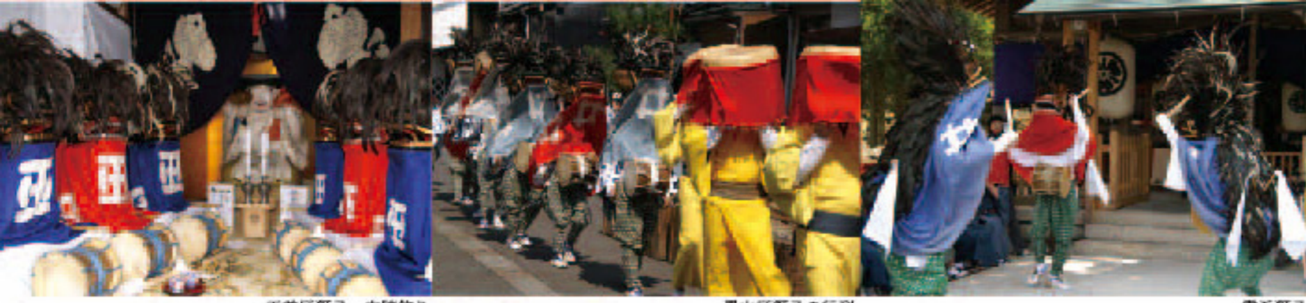
玉前区獅子 本陣飾り