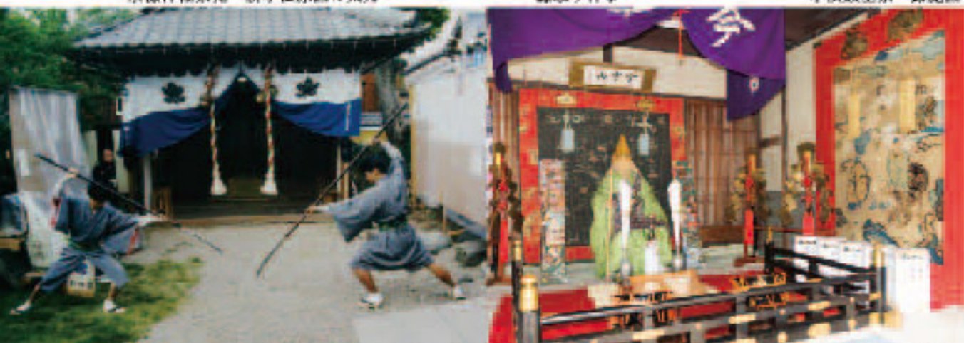
御旅所入御前の「大鎌刀」 高浜七年祭 中ノ山