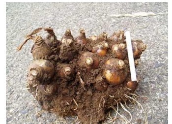
3年以上経つと球根が分かれて過密状態となります。