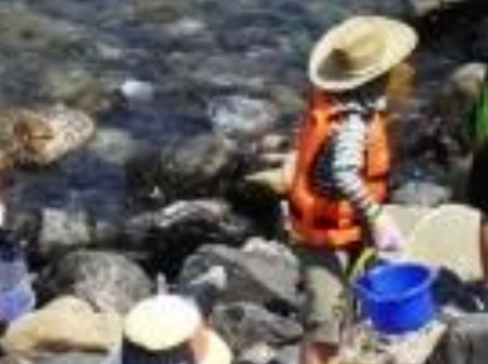
採集できた生きものを観察し、 解説を行います。