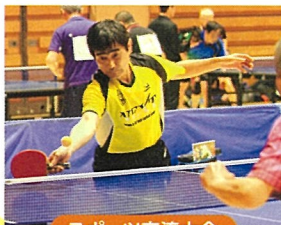
スポーツ交流大会