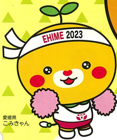
愛媛県 こみぎゃん