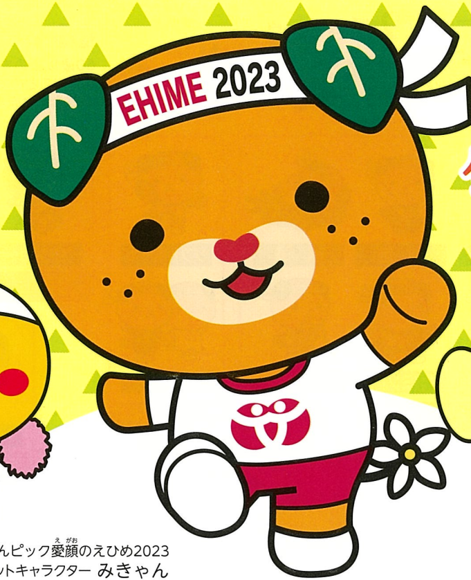
ねんりんピック愛顔のえひめ2023 マスコットキャラクター みぎゃん