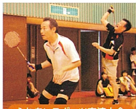
ふれあいスポーツ交流大会