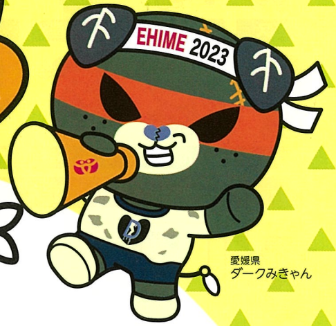
愛媛県 ダークみぎゃん