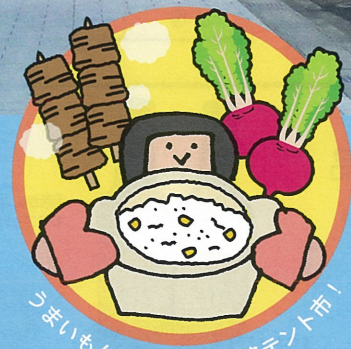
うまいもんズラリ! 若狭路テント市!