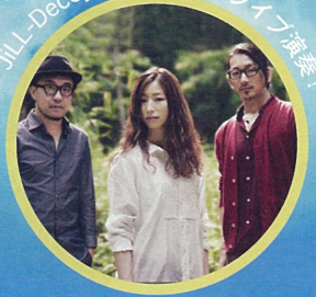
JiLL-Decoy association ライブ演奏!