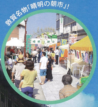
敦賀名物「清明の朝市」!