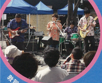
敦賀ベンチャーズライブ!