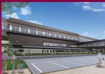
あわらおんせん 芦原温泉駅