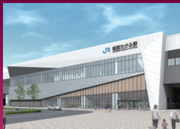
えちぜん 越前たけふ駅