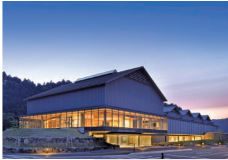
一乗谷朝倉氏遺跡博物館

2022年10月1日、中世都市遺跡「一乗谷朝倉氏遺跡」の全体像や歴史的価値を楽しみながら学べる博物館が開館。戦国大名朝倉氏の当主が暮らした館の一部を原寸で再現、遺構の露出展示、城下の町並みを再現した巨大ジオラマなどが見どころ。