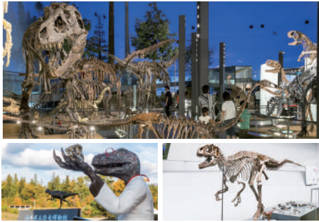
恐竜博物館 【2023年7月14日リニューアルオープン】

福井県勝山市は恐竜化石の一大産地。その化石を収蔵する恐竜博物館は恐竜全身骨格をはじめ、化石やジオラマ、大迫力の復元模型などが数多く展示。世界三大恐竜博物館の一つとも言われ、大人から子供まで楽しめる。