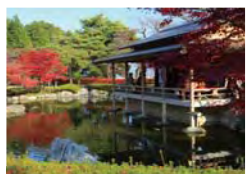
公園内にある鸛陽庭園

春のさくら、初夏のつつじ、秋のもみじ、冬の雪つりなど四季折々の景観が楽しめ、「つつじまつり」や「もみじまつり」には多くの人で賑わいます。