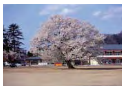
味真野小学校の桜

味真野小学校の校庭の真ん中には樹齢130年余りの桜の木があります。桜の見頃にはライトアップされ、校庭に自由に入ることができます。