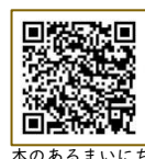
本のあるまいにち