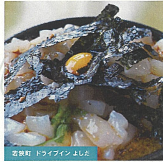
若狭町 ドライフィンよしだ