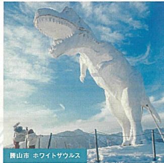
勝山市 ホワイトザウルス