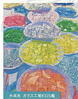
小浜市 ガラス工房KEIS庵