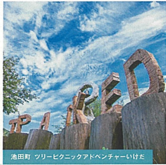
池田町 ツリービクニックアドベンチャーいけだ