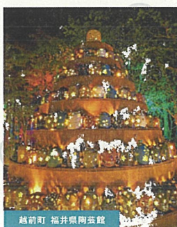
越前町 福井県陶芸館