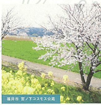
福井市 宮ノ下コスモス公園