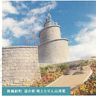
南越前町 道の駅 南えちぜん山海里