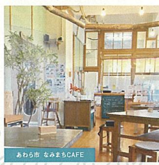
あわら市 なみまちCAFE