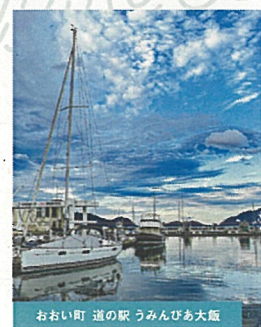
おおい町 道の駅 うみんびあ大坂