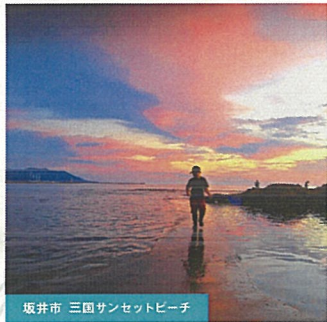
坂井市 三国サンセットビーチ