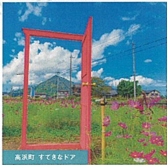
高浜町 すてきなドア