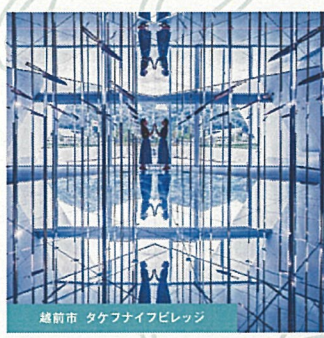
越前市 タケフナイアビレッジ