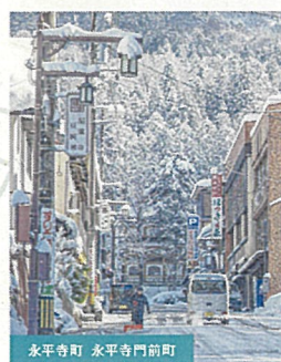
永平寺町 永平寺門前町