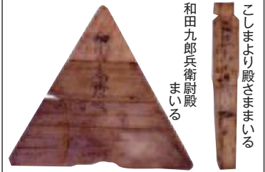
和田九郎兵衛尉殿 まいる