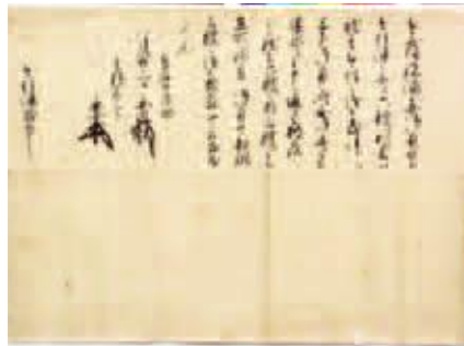
〔西野次郎兵衛家文書〕南越前町教育委員会所蔵