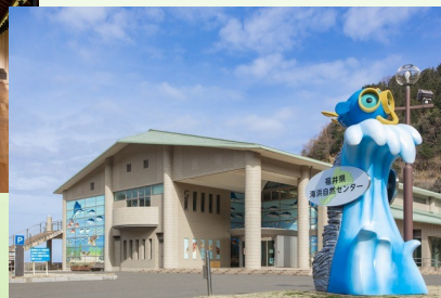
福井県海浜自然センター