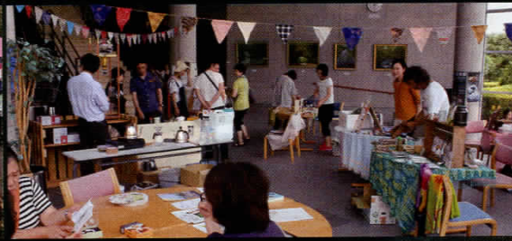
※写真は過去に行われた夢わかマルシェの様子です。